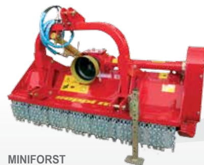
MINIFORST Modèle forestier classique sans dispositif pick-up nécessite 55 - 90 CV à la pdf. Broyage de buissons et de bois jusqu'à 12 cm Ø.

Broyeurs costauds avec dispositif pick-up et grille d'affinage pour broyer les bois de taille de façon fine et homogène.